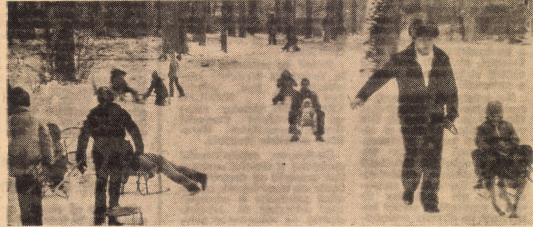
La săniuș în parcul „Sub arini” din Sibiu

PREMIUL III. Sibiu: întreprinderea „7 Noiembrie”, întreprinderea „Independența”; Mediaș: Biblioteca întreprinderii mecanice gaz metan, clubul „I.L. Caragiale”.