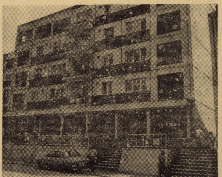
Dintre noile construcții de locuințe cu parter comercial, ridicate în anii din urmă în centrul orașului Ocna Sibiului

Așadar, prima întreprindere din județ intrată masiv pe magistrala informaticii industriale va fi și prima care va face pasul decisiv în teritoriul de mare și frumoasă disponibilitate al dialogului om-mașină în interesul major al progresului social-economic multilateral al tuturor meleagurilor patriei, în această epocă de mare profunzime a mutațiilor calitative.