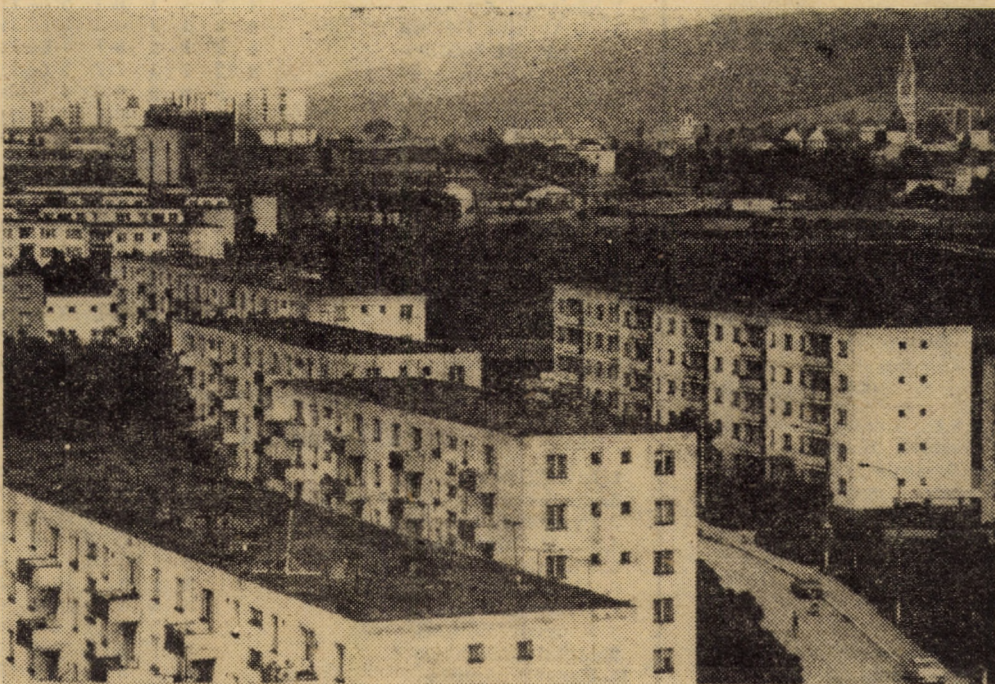
Ca și alte localități ale județului nostru, municipiul Mediaș a cunoscut în ultimii 20 de ani o amplă dezvoltare industrială și social-edilitară