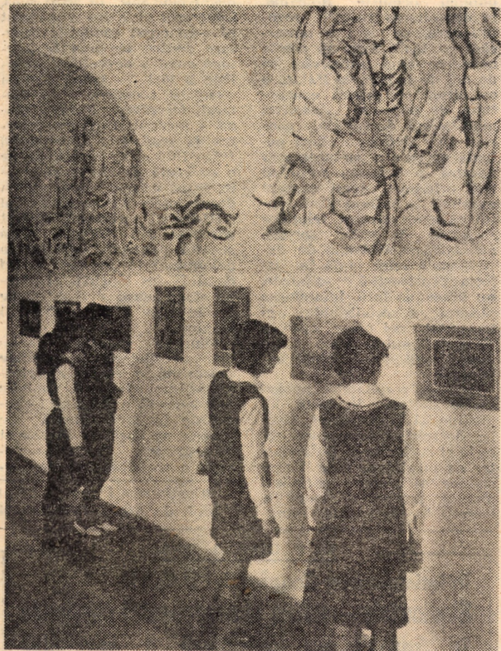
La Liceul pedagogic Sibiu: un hol, nu perete, o superbă pictură murală, sub care își găesc locul, cum nu se poate mai bine, desene ale copiilor. Merită să fie văzută această expoziție a purității și gingășiei

te de cetățeni din mediul rural au fost antrenati la lucrări pe pașiști, la refacerea căilor de acces în cimp. În toate localitățile rurale, la chemarea organizațiilor de partid, locuitorii sâtelor acționează cu hotărâre și răspundere pentru executarea la timp și de calitate a tuturor lucrărilor, pentru obținerea în acest an a unor recolte mari și sigure.