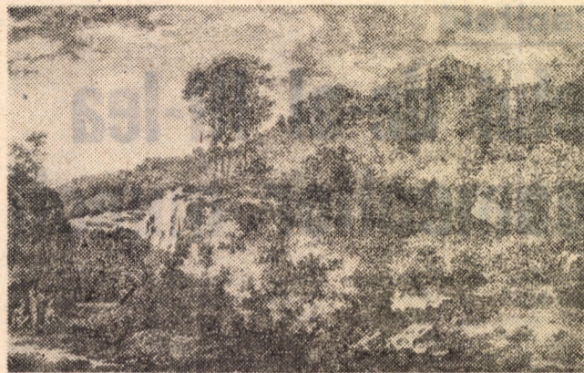
S. Gessner: „Peisaj”