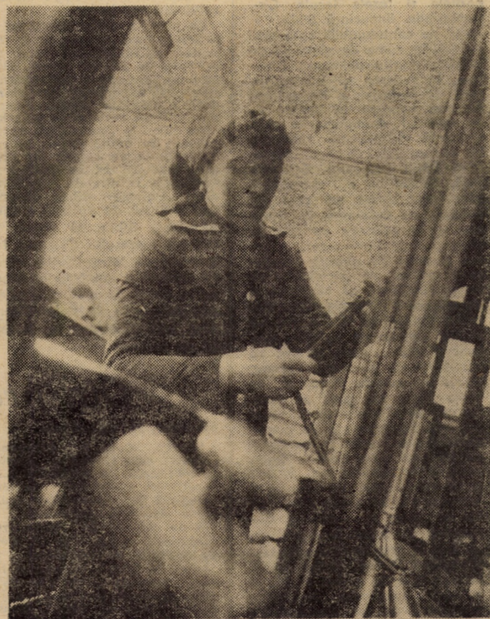
Aspect din secția țesătorie mochetă netede a întreprinderii textile „Dumbrava” din Sibiu

Au fost abordate, de asemenea, unele aspecte ale vieții internaționale. S-a subliniat că, în condițiile actuale, deosebit de complexe, ale situației politice mondiale este mai necesară ca oricînd întărirea conlucrării tuturor popoarelor, forțelor înaintate de pretutindeni pentru oprirea cursei înarmărilor, în primul rînd a celor nucleare, încetarea experiențelor cu arme nucleare, reducerea armamentelor convenționale, a efectivelor și cheltuielilor militare, asigurarea păcii și securității popoarelor.