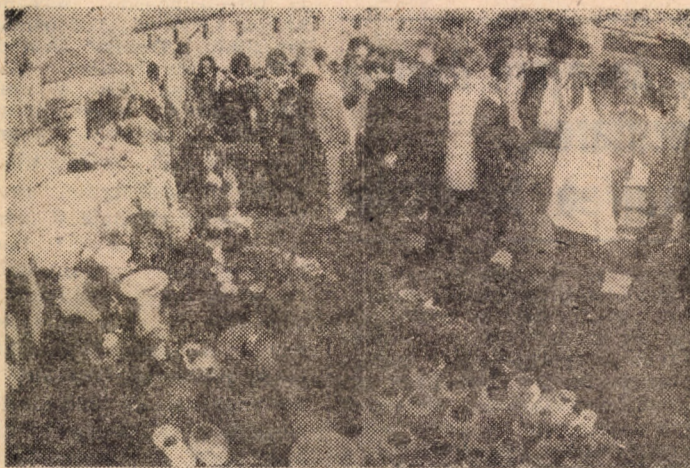
Aspecte de la deschiderea ediției „Cibinium '86”

Asemenea manifestări vor avea loc și în alte localități ale județului.