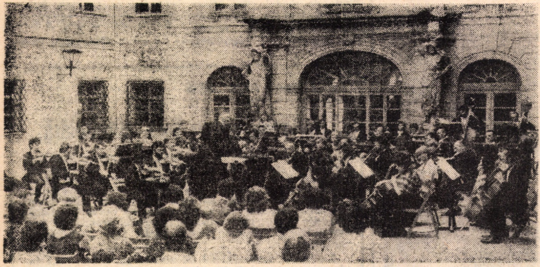
Concertul simfonic estival, desfășurat de curînd în decorul arhitectonic și în ambianța acustică atât de favorabile ale curții interioare a Palatului „Brukenthal”, tînde s statornici un act de cultură tradițional și implicit, specific Sibiului. Sonoritățile stentice ale muzicii lui Strauss și trepidăția ritmică a unor pagini muzicale de divertisment contemporan au răsunat amplu și limpede delectînd realtente un auditoriu sensibil și competent.