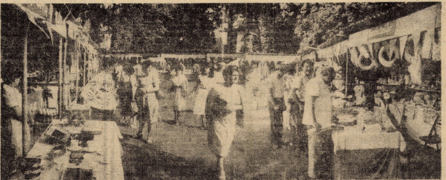
Tîrgul de vară al cooperăției de producție, achiziții și desfacerea mărfurilor Sibiu vă mai stă la dispoziție pînă miercuri, 15 iulie a.c. Începînd de ieri, alte opt cooperative Prezentele imagini vă vor trezi și ele, desigur, curiozitatea

Cei interesați pot cumpăra bilete la prețul de 25 lei de la Agenția teatrală — str. N. Bălcescu nr. 17 Sibiu, sau de la casele de bilete ale stadionului, în ziua spectacolului.