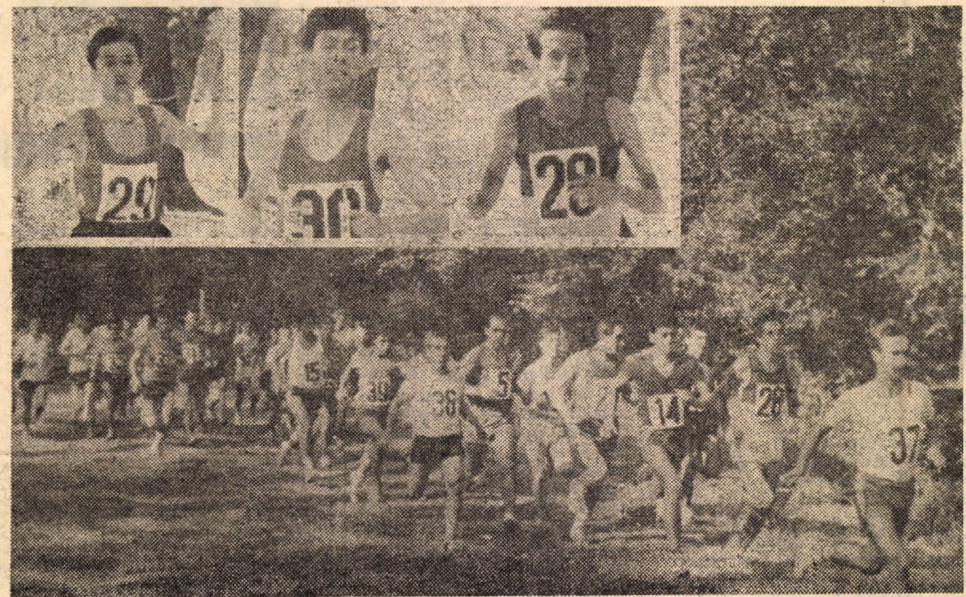
Aspect din cadrul „Crosului Armatei” desfășurat duminică pe traseele din parcul „Sub arini” din Sibiu, în cele 3 medalioane cîștigătorii probelor