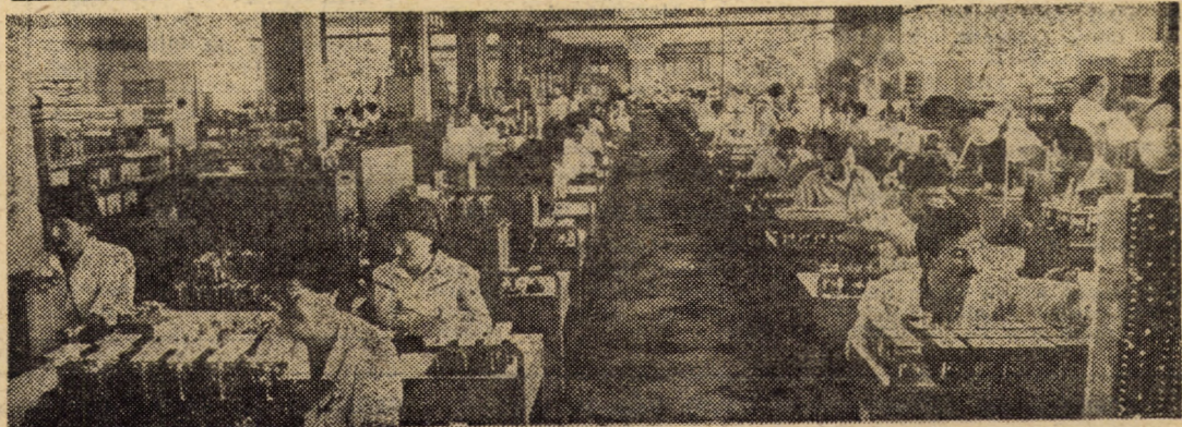
Întreprinderea de rele Mediaș: linia de montaj a releelor de comandă, folosite la diferite instalații de automatizare