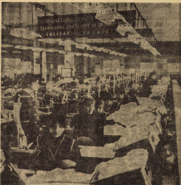
Întreprinderea „Drapelul roșu” Sibiu. Calitatea produselor — unul din obiectivele atelierului de confecționat lenjerie pentru femei — se află permanent în atenția tinerelor muncitoare