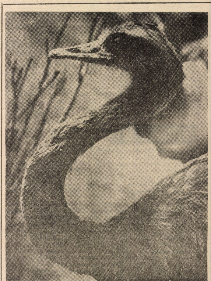
Încîntat de cunoștință, Spune struțul îngîmfat. Nu m-aplec, cu umilință, Căci mi-e gitul... ondulat!

• Igor Ladan are 7 ani și... 1,80 m înălțime. Medicii sovietici n-au reușit să-i oprimească creșterea așa că, la această oră, Igor se află în tratament la o clinică din S.U.A. Cum e lumea asta: știu o groază de oameni care ar da cîțiva ani din viață pentru cîțiva centimetri în plus, iar Igor vrea să nu mai crească... • Potrivit unui sondaj de opinie, majoritatea francezilor o consideră pe Catherine Deneuve drept actrița nr. 1 a anilor '80. Și nu mai e la prima tinerețe. Dar dacă ar fi fost? • În Ungaria s-a înființat un nou partid: Partidul Consumatoristilor Subțiri, care își reia activitatea după 40 de ani de... ilegalitate. Lozincă partidului: „Consumă azi mai mult decît ieri”. Purtătoare de cuvînt este doamna Margareta Kintaru care cîntărește... 146 kg. Asta da partid! • La funeraliile unui ciine pe nume Lazarus, care au avut loc la San Francisco, au asistat circa 10 000 de persoane. Bineînțeles că stăpînul potăii nu este un fitecine, ci un... mic miliardar. Unii se scaldă în bani, alții cerșesc pe la colțuri. Așa a fost și, se pare, așa va fi cît e lumea... (n.i.d.)