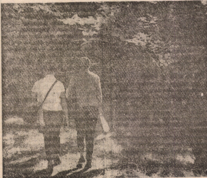
La pas, pe frumoasele poteci ale codrilor

art. 29, prevede: „Conferința filialelor județene sau a municipiului București se convoacă în sesiuni ordinare o dată la 5 ani, iar în sesiuni extraordinare, ca urmare a hotărîrii organelor centrale sau la cererea majorității membrilor filialei”. Așadar, convocarea făcută de pretinsul Comitet de inițiativă, care nu ne reprezintă și pe care nu-l recunoaștem, nu ne aparține.”