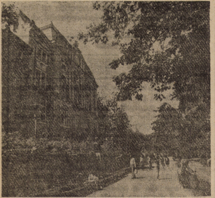
O adresă și o invitație în lumea fascinantă a cărților: Biblioteca Județeană „Astra” din Sibiu.