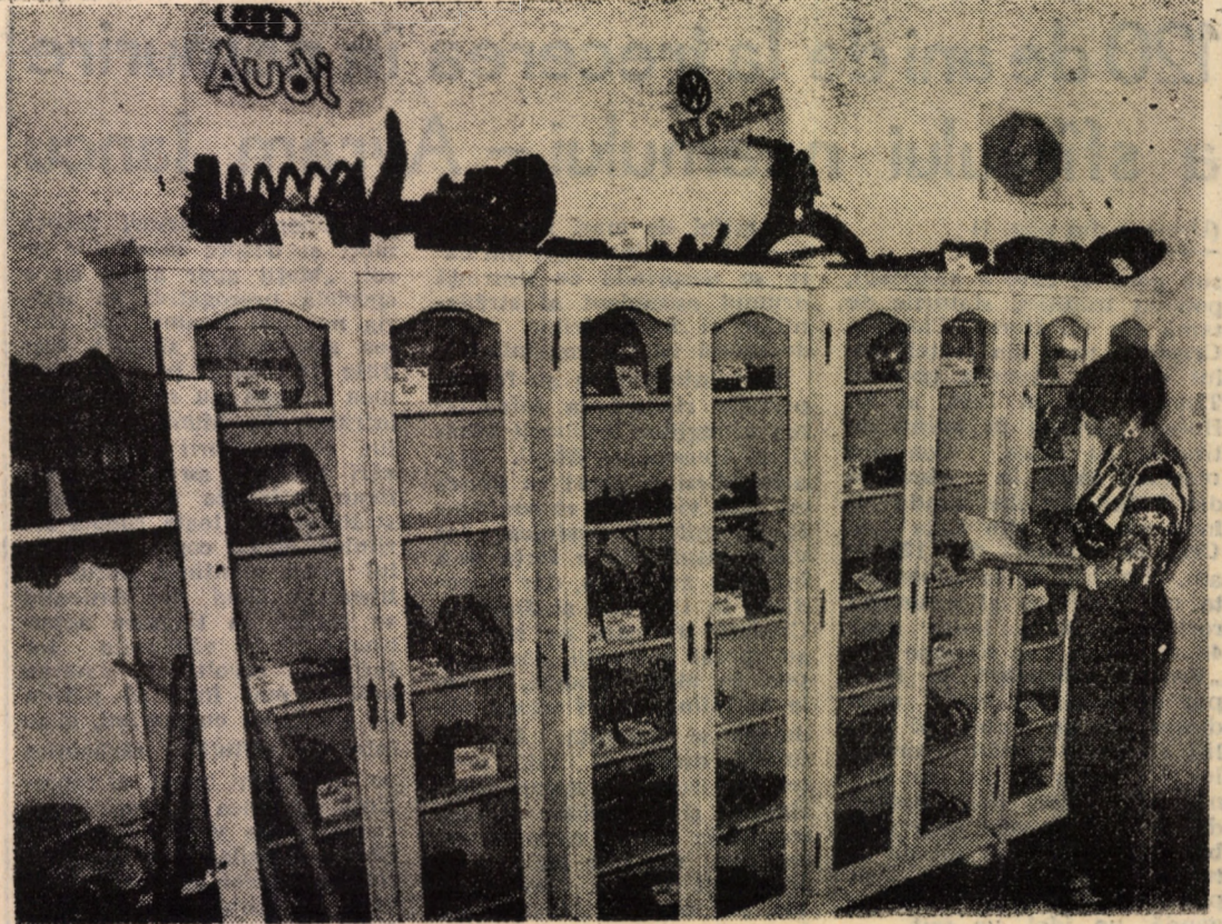
Cunoscutul magazin de piese auto al S.C. „EMMA” S.R.L. din Sibiu (str. V. Cârlova, clădirea A.C.R.) și-a mărit recent gama pieselor de schimb pentru autoturisme, pe care le oferă. Pe lângă piese pentru autoturismele „DACIA” și „OLTCIT”, aici puteți găsi mai nou piese pentru „AUDI”, „VOLKSWAGEN” și „RENAULT”. Iar gama acestora va fi în curînd lărgită

*) Istoria și telurile pedagogiei Waldorf, de Ernest Schubert.