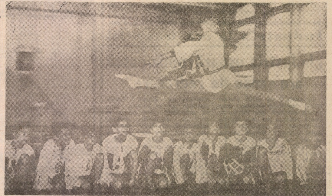
Demonstrație de performanță, dar și de înaltă ținută artistică, a micilor gimnaste sibiene, de curînd revenite dintr-un turneu în Franța.

Dacă vor să scape cu fața curată — fără amenzi și fără confiscări — agenții economici de toate calibrele și profilurile n-au decît să se pună la punct cu legislația și s-o respecte întocmai pentru că organele de control n-au de gînd să acorde nici un fel de circumstanțe atenuante! (n.i.d.)