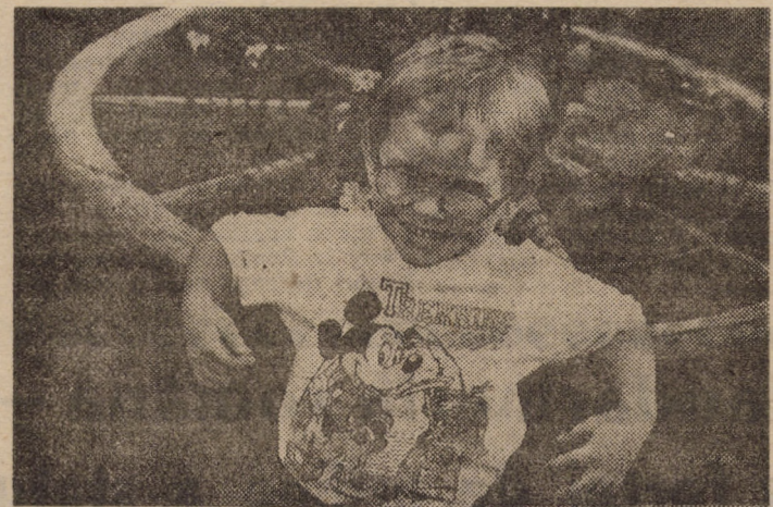
Cînd voi deveni eu fermier, economia noastră de piață va fi cît roata cafului...

Pentru noi sibienii ceea ce s-a întîmplat trebuie să constituie un avertisment. În cel mai scurt timp toate asociațiile de locatari trebuie să-și regleze „conturile” cu locatarii restanțieri sau răi platnici să-și completeze fondurile de rulment pînă la nivelul planificat. Dacă nu vor fi lichidate acum restanțele, în plină iarnă, cînd taxele vor fi foarte mari, va fi prea tîrziu. Confrunțați cu gerul iernii, cei mulți corecți și buni platnici s-ar putea să „reacționeze” și să-și verse minia pe cel puțin din a căror viață li s-a tăiat căldura. Epoca traiului „colectivist” e pe sfîrșite. Ce vor face pensionarii sau șomerii? Asta e altă mîncare de peste la care vor trebui să mediteze cei pe care li vom alege la 27 septembrie la fruntea țării.