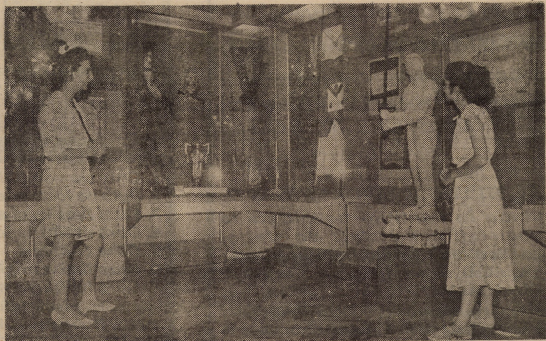
Vacanța cu bucuriile ei rezervă elevilor clipe de odihnă, relaxare dar și de cunoaștere. Cîteva minule petrecute în Muzeul de Istorie ne pot clarifica multe aspecte din istoria Sibiului.