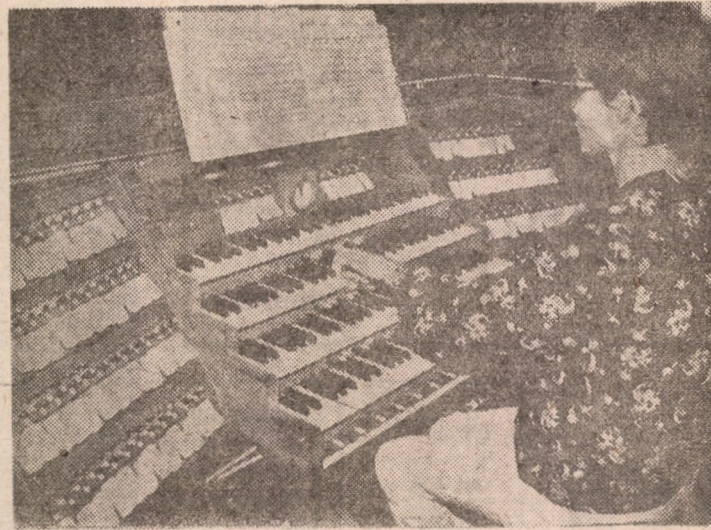
O imagine cu valoare de invitație la concertele de orgă, din stagiunea estivală, ce au loc la Catedrala Evanghelică din Sibiu.