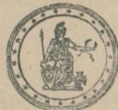
Medalie de bronz