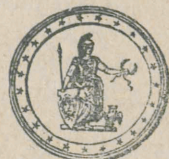
Medalie de bronz