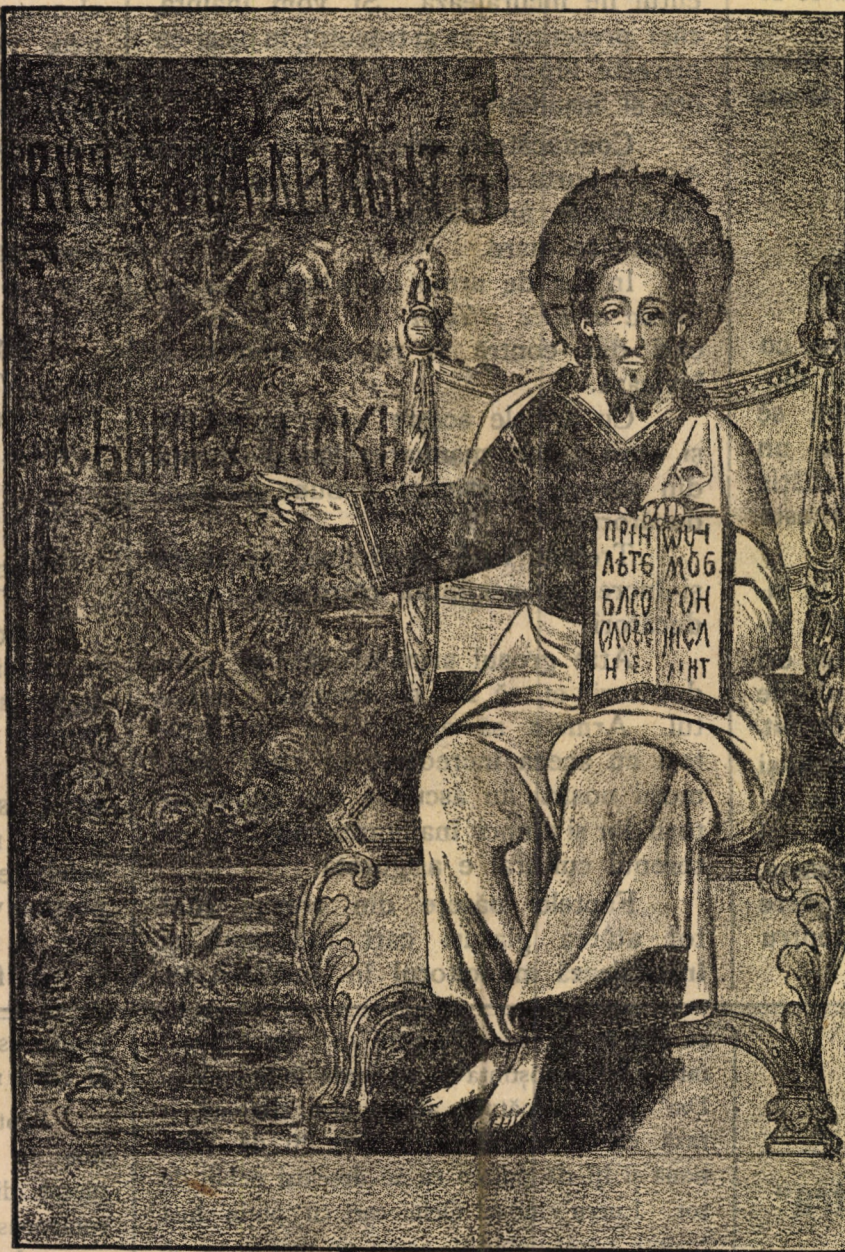
Steagul oștirii muntenești la încunjurarea Vienei.

Sobiesky, ajutat și de oastea împărătească, sfărîmă armia turcească, și Viena și întreaga creștinătate fū mântuită de o mare primejdie.