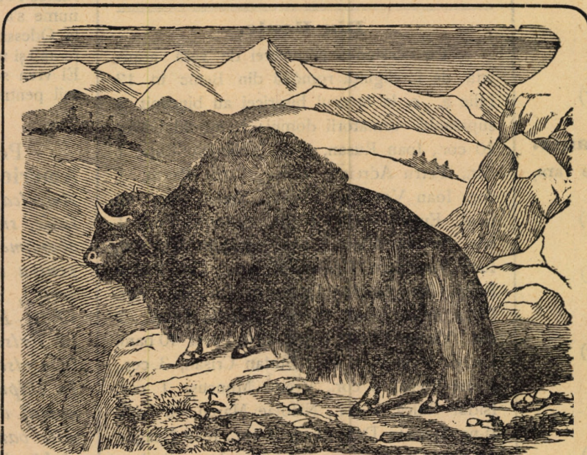
Bourul sau zimbrul.

37 de anecdote și glume alese cuprind cea mai nouă broșură din Biblioteca »Foi Pop«. Nr. 6 cu titlul »Ris