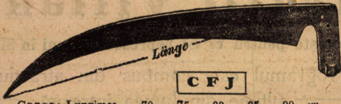
Coase: Lungimea 70 75 80 85 90 cm. 1 bucată C. 1.60 1.60 1.60 2.— 2.—