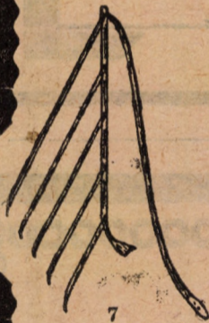
Nicovale pt. coase Forma fig. 2 3 1 buc. C. —.96 —.86