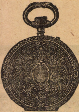
Nr. 4017 A