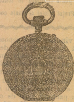
Nr. 4017 A

Novitãți în toate soiurile de oroloage, juvaere, artioli de aur și argint, cadouri de nuntã și botez, inele de fidanțare gata, cercei, lanțuri de oroloage, brãțare, utensilii pentru biserici și masã, obiecte de lux de toate soiurile în aur și argint.