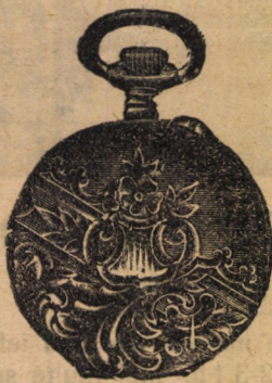
Nr. 3128 A