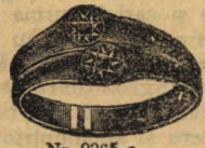
Nr. 9265 a

Novități în toate soiurile de oroloage, juvaere, articli de aur și argint, cadouri de nuntă și botez, inele de fidanțare gata, cercei, lanțuri de oroloage, brățare, utensilii pentru biserici și masă, obiecte de lux de toate soiurile în aur și argint.