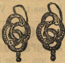
Nr. 8894 a