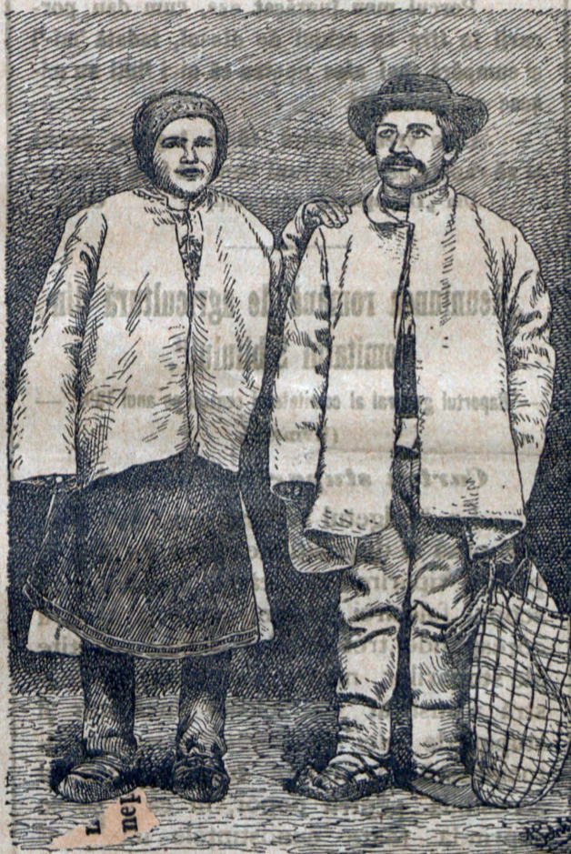
Mocani dela Mogos.

Este neapărat de lipsă ca crumpe-nile, legumele, rădăcinile și poamele să se așeze numai după-ce s'au sbicit deplin, pentru-că la din contră ușor se poate începe putrezirea și mai cu seamă fiind pivnița prea călduroasă. De aceea înainte