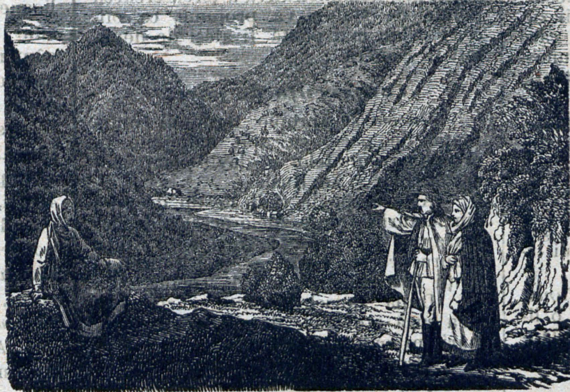
Un pas prin munții nostri.

Stipendiștii cari ajung calfe și sodali, pentru a face experiență în alte localități și țeri străine, încă vor fi ajutoați, ear' aceia, cari devin măiestri sau negustori și artiști de sine stătători, dacă se căsătoresc primesc împrumuturi fără cametă, ceea-ce au să-l replătească în rate anuale de câte 20% în 10 ani. 5% din venitul anual al fundației merge pe seama parochului român gr-cat. din Sibiiu, având acesta obligament a ține în tot anul o litur-