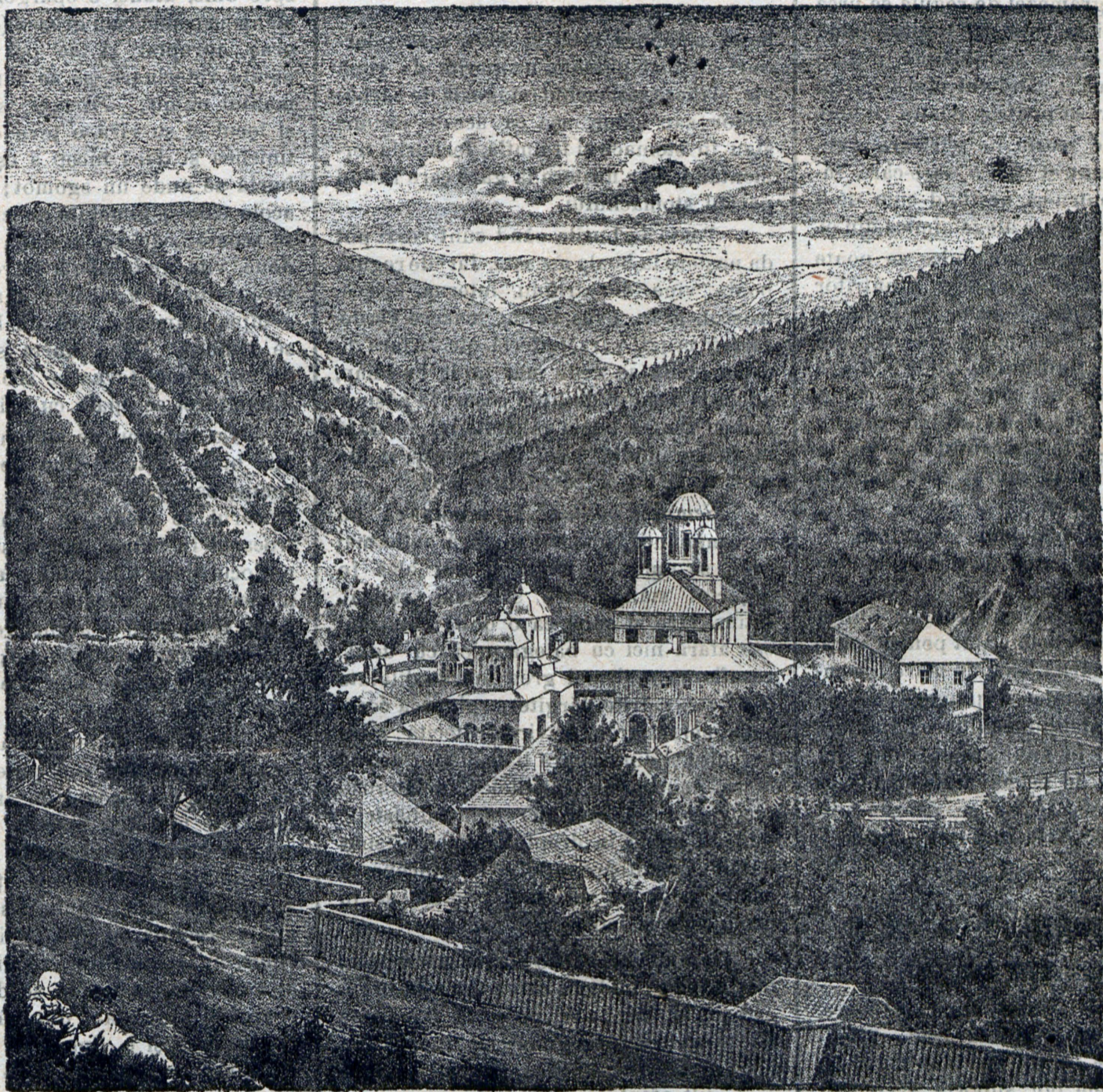
Mănăstirea din Sinaia.

După sîmănat locul se grapă și apoi se tăvăluște, pentru-ca brușii să nu ne împedece cu prilejul cositului, care se face cu deosebire cînd cucuruzului 'i-a dat spicul; pentru-că atunci se câștigă mai mult nutreț. Se cosește și cînd el a ajuns la înălțime de o jumătate metru; nu trebuie însă lăsat să devină lemnos. Cositul se face în toată ziua sau și la două zile, dîndu-se animalelor sau întreg, sau tăiat mărunt și amestecat cu alte nutrețuri. Dac̃a cucuruzul se dă netăiat, de regulă vitele trebuie să capete după el fîn sau paie tăiate mărunt