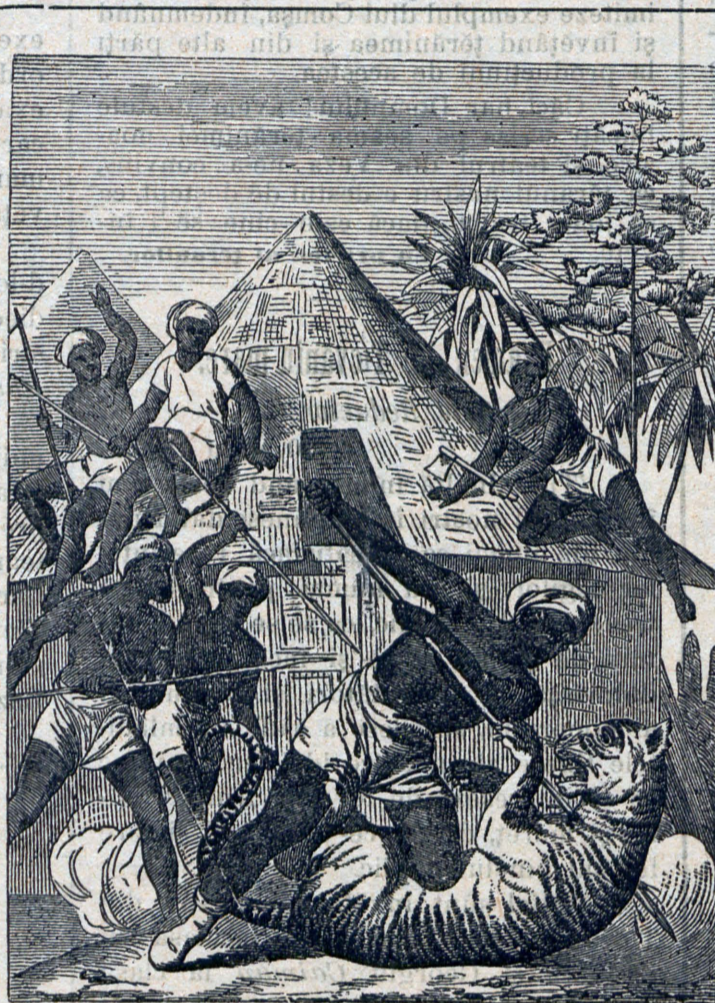
Lupta cu tigri.