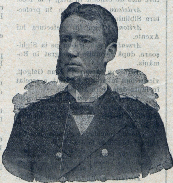
Contele Thun de Hohenstein.

În ori-ce cas atât în Austria , cât și la noi în Ungaria, pace deplină numai atunci va fi între popoare, când nu vor fi apăsători și apesați, ci toate popoarele se vor bucura de drepturi deopotrivă, ceea-ce în interesul împărăției trebuie să se facă.