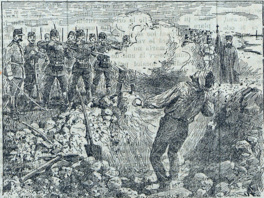
Impuscarea lui Knezvici.

că au fost grănițeri și cât de voe bună, cât de silă s'au ocupat cu pomăritul. ear' azi se ocupă unii într'un mod într'adevăr rațional, și totuși sunt departe de Sași. Dacă Bărgăuanii nu fac destul pentru acest ram de economie, atunci Românii noștri din alte părți putem zice că nu fac aproape nimic. Va zice poate bunul cetitor: »De ce mai umplu foile noastre tot cu muștrări de acestea? Că destul ne amărăsc alții zilele cu muștrări! Barem gazetele noastre nu ne mai scoată ochii cu astfel de imputări!