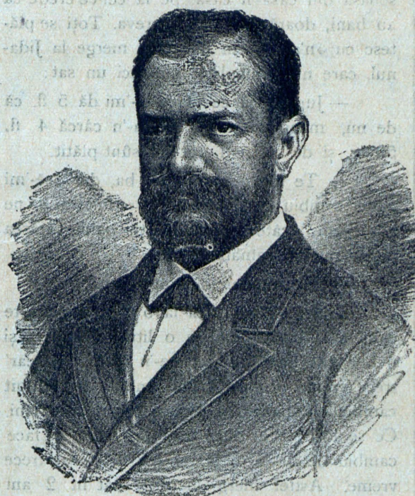
Grigore G. Tocilescu.

Am zis mai sus, că soiul are o înfrîntă foarte însemnată pentru îngrășat. Acum trebuie să mai adaugem și aceea, că porcii puși pe îngrășat se mai