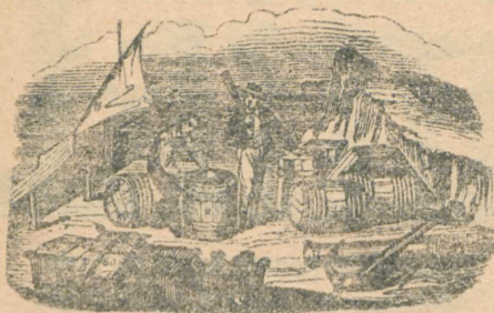
Târgurile din săptămâna aceasta