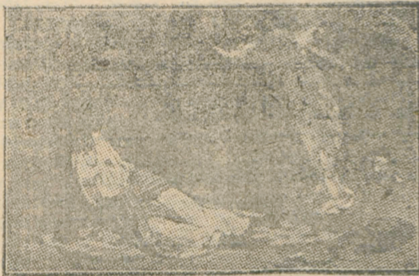
Agar in pustie.

Despre Agar, slujnica lui Avram, ne spune Biblia, că după ce a fost izgonită din casa lui Avram, a ajuns în pustie cu copilul ei. Rătăcind prin pustie i s'a sfârșit pâinea și apa și ca să nu-și vadă cu ochii copilul murind de sete, îl lapădă sub un tufiș și depărtându-se puțin dela dânsul își ridică ochii spre cer și plânse și începă și copilul să plângă. Și au auzit Domnul glasul Agarei și al copilului și a trimis înger din cer care i-a zis: «nu te teme Agar». «Și a deschis Dumnezeu ochii ei și a văzut fântâna de apă vie și mergând și-a adăpat pruncul». (Facere cap 21).