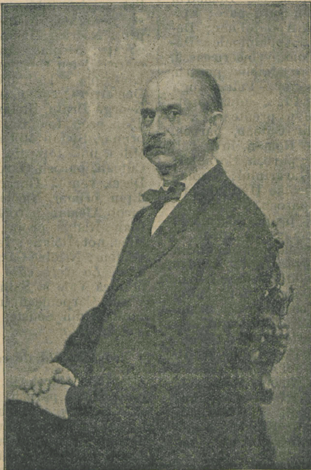
DIMITRIE MOLDOVAN (1811—1889).

Dimitrie Moldovan a fost un bărbat rar al neamului românesc. Începând dela 1832 lucră în restimp de 51 ani, dacă nu mai mult, dar tot atât cât a lucrat Cipariu pe câmpul literaturii, dezvoltării și înfrumusețării limbei românești și cât a lucrat G. Barițiu pe câmpul ziaristicii și politicei neamului nostru. Atâta numai că pe când lucrurile celor doi sunt aproape toate publicate și cunoscute de toată lumea, lucrurile lui Dimitrie Moldovan pe toate terenurile, dar cu deosebire pe terenul administrațiunei politice, ca jude primar la 1848 în comitatul Hunedoarei, ca adjunct de district al Albei-de-jos unit cu comitatul Hunedoarei și subîmpărțit în 12 cercuri: la Pui, Hațeg, Deva, Baia-de-Criș, Câmpeni, Alba-Iulia, Vințul-de-jos, Vingard, Blaj, Teuș Uioara, Jernot, dela 10 Septemvrie 1849 până la începutul anului 1849 și dela acest timp ca prefect (Kreis comis I. clasa) la Orăștie după ce împărți prefectura dela Alba-Iulia în două prfecturi pen-