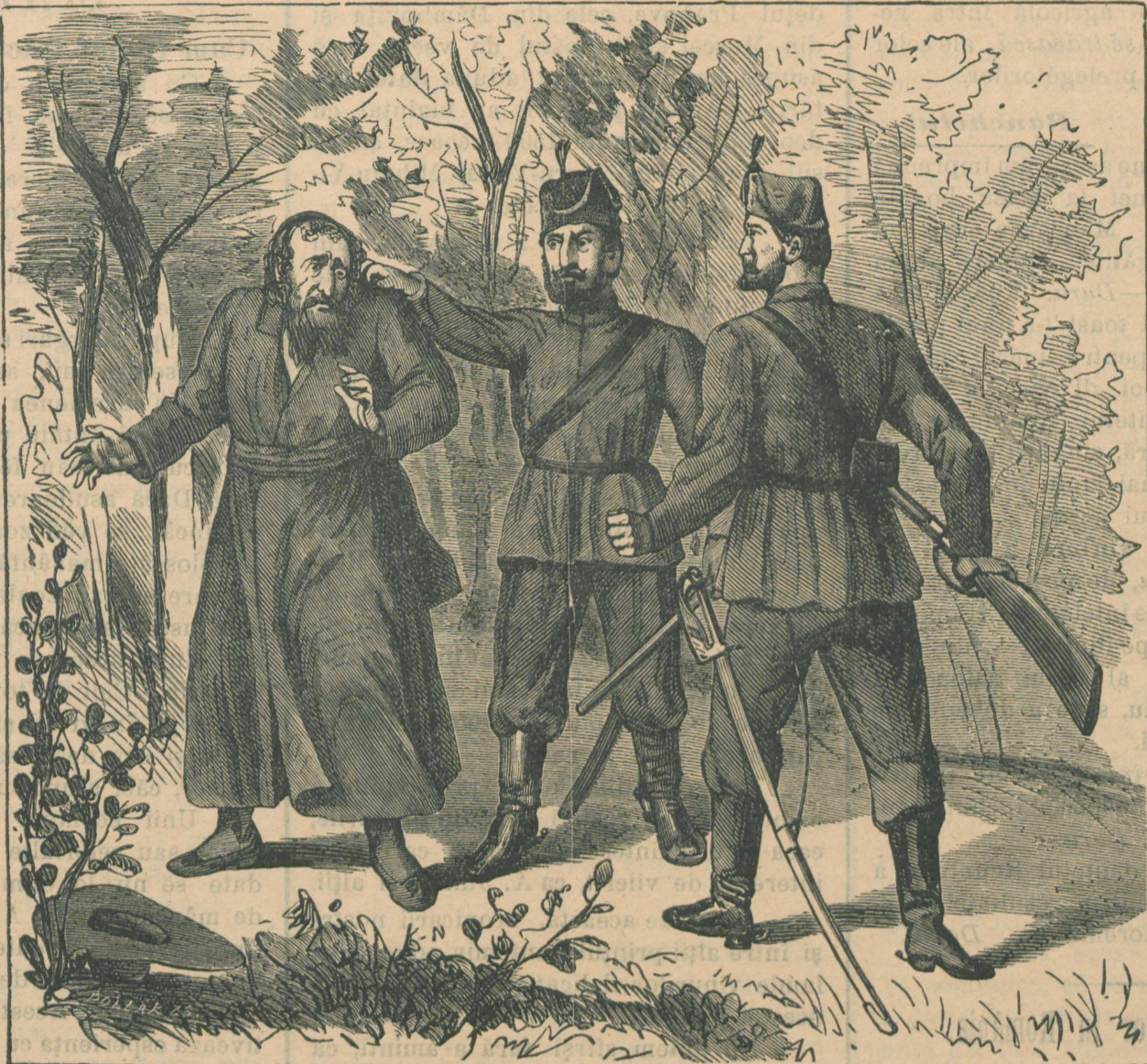
Prins cu mișelia.