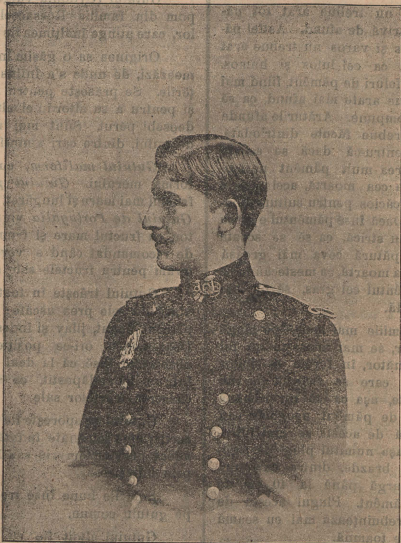
Moștenitorul tronului României.