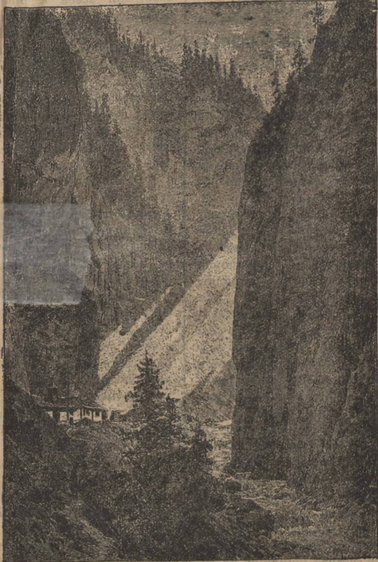
Strimtoarea dela Ialomita.