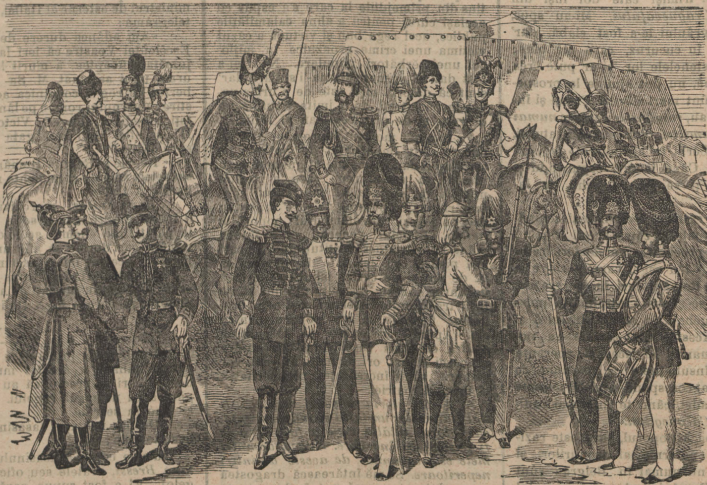
Tipuri din armata rusească.