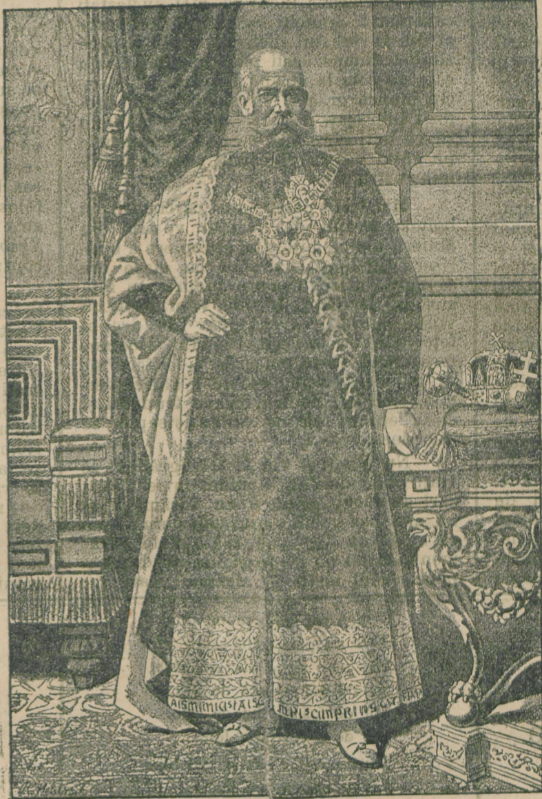
FRANCISC IOSIF I.

familia domnitoare. Ea totdeauna s'a purtat față de noi cu dragoste și iubire și ne-a ajutat și îmbunătățit soarta și încât s'a putut ne-a ocrotit față de împilatori și apăsători. De aceea Români au fost și sînt credincioși față de familia domnitoare. În inima lor e neperitoare aducerea aminte de unii domnitori, cum a fost și bunul împărat din veacul trecut, Iosif II. care cu inima sa nobilă a ușurat soarta iobagilor, deslegându-i de glie. Apoi pentru Români