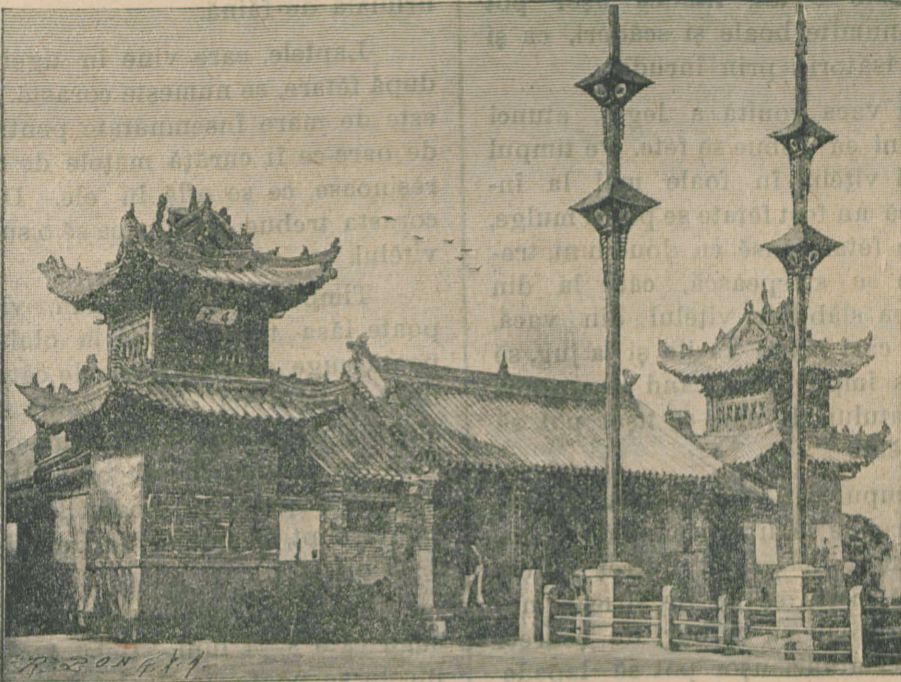
O biserică chineză.