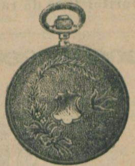
Nr. 2. Orologiu anker-remon. de argint, 50 mm. diametru, cu capac duplu, toc guiloșat ori gravat, 3 capace de argint, 5 rubine, sorte tari, I. fină »Uraniaerke« 15 rubine, fl. 12.50.