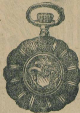
Nr. 6. Orologiu de dame, rem., de aur de 14 carate, 30 mm. diametru, capac duplu, I. calitate, guiloșat ori gravat fl. 25.—, în toc de argint fl. 11.50.