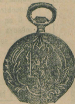
Nr. 5. Orologiu anker-remon. de argint, 50 mm. diametru, capac duplu, 3 capace de argint, 15 rubine, cu cerc de aur, fabricat fin, din sorte mai tari fl. 11.50, cu construcție cil. rem. fl. 9.50.