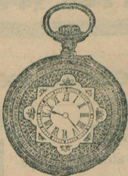
Nr. 1. Orologiu de argint remon-toir, pentru dame; 30 mm. diametru, cu capac de argint, calitate bună fl. 6.75, cu cerc de aur fl. 7.50, de oțel negru oxidat fl. 6.50.

Reparatură de tot soiul se eșcută bine și conștientșos.