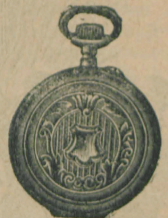
Nr. 7. Orologiu cilindru-rem. de argint nou, 48 mm. diametru, luciu ori gravat, în formă ovală, arătător de secunde, cu placă de cifre albă, emailată, I. calitate, fl. 4.50, cu capace duplu fl. 5.80. Lanțuri de nikkel cu compas ori cheia 30, 40, 50, 60 cr.