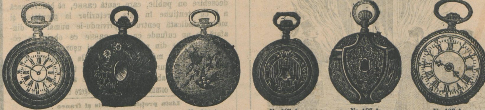
Nr. 183 A. Orologiu de nichel remon-toir, 50 mm., calitate bună fl. 3.40, același de calitate mai bună fl. 4.10, același cu 3 copereșinte tari fl. 4.40, același cu trei cope-reșinte de calitate mai bună fl. 5.75.