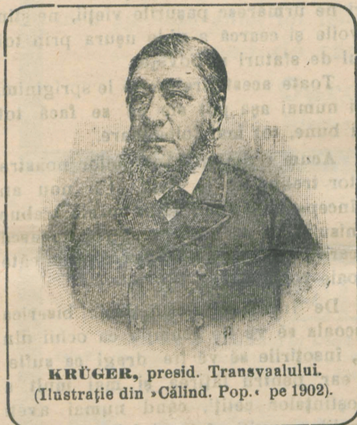
KRÜGER, presid. Transvaalului. (Ilustrație din »Călimd. Pop.« pe 1902).