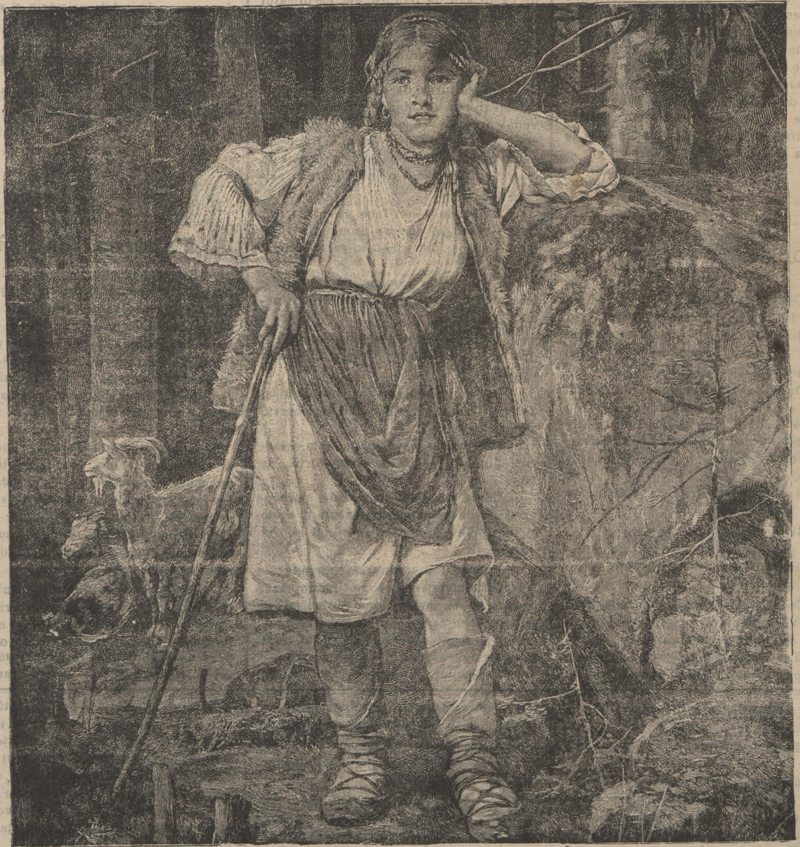
Păstoriță din Bihor.