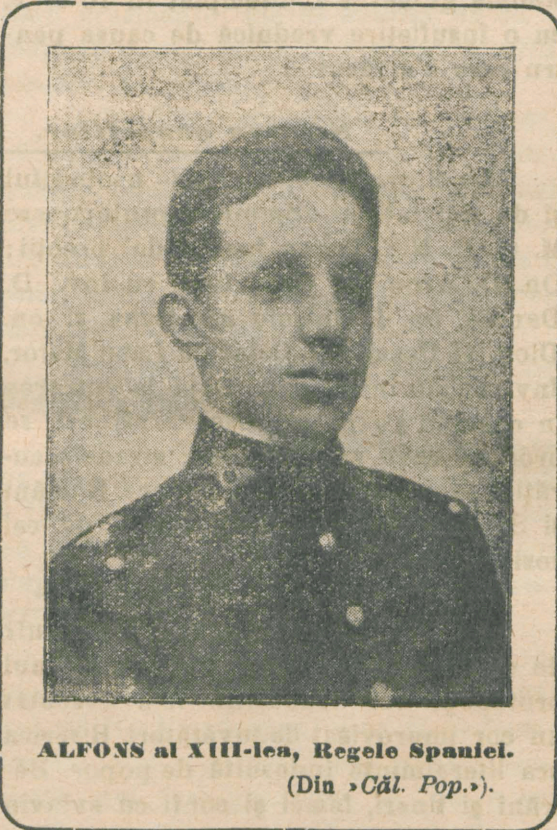
ALFONS al XIII-lea, Regele Spaniei.