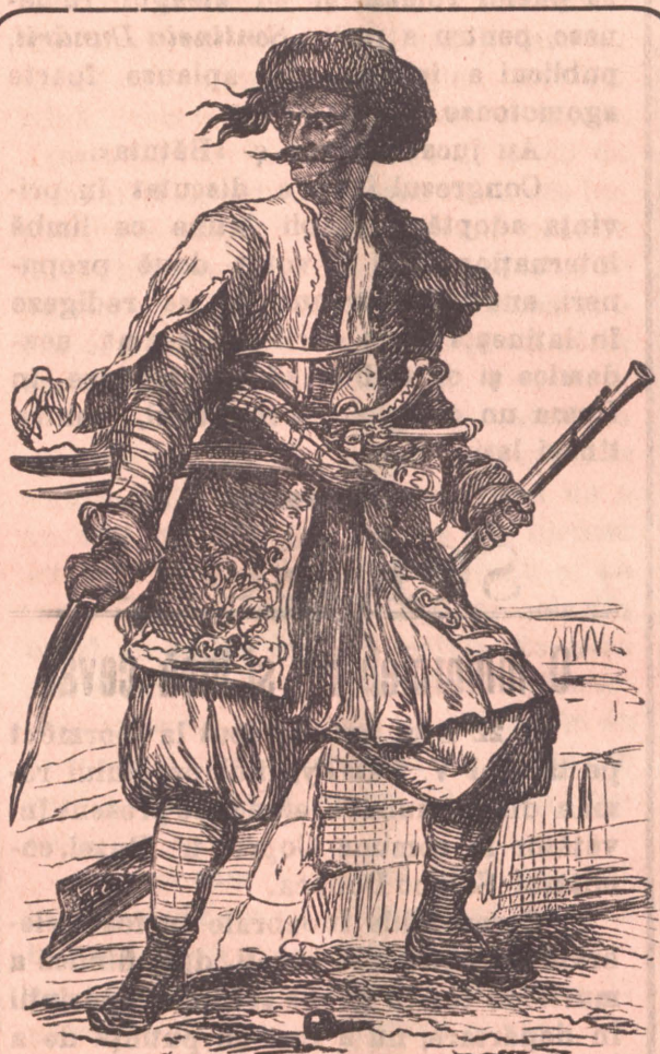
Un luptător din Macedonia.

Armășarii adesea se apucă la luptă violentă între ei, cei tineri își câștigă