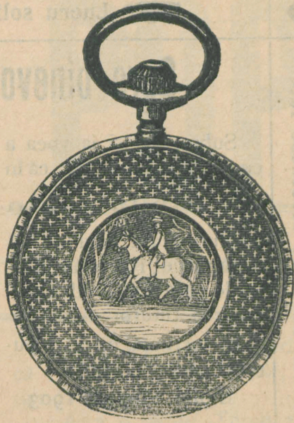
Nr. 160 F.

cel mai bun din lume, se sventă curând, are lustru foarte frumos și nu strică pelea de loc. — Înfințat la anul 1832. — Depositul fabricii Viena I. Schulstrasse nr. 21. 4 49—52 Se capătă în toate locurile.