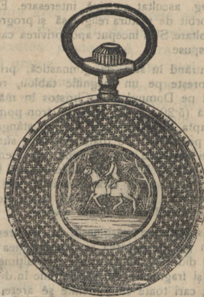
Nr. 160 F.

Lațuri de argint 2 cor. 90 bani pînă la 10 cor. Șinoare pentru orologiu, 20, 30, 50 bani.