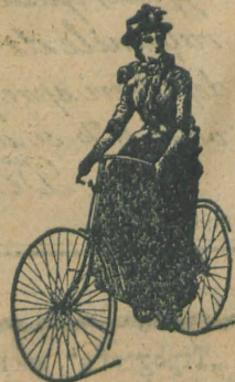
Lista prețurilor gratis.

Biciclete de tot soiul din cele mai solide și mai ușurele, pe lângă prețurile cele mai moderate de fabrică.