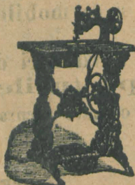
Cea mai extinsă garanță.