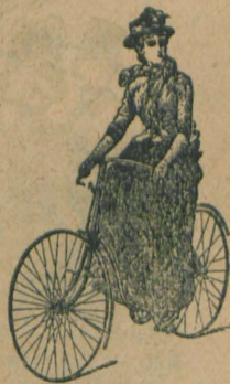
Lista prețurilor gratis.

Biciclete de tot soiul din cele mai solide și mai ușurele, pe lângă prețurile cele mai moderate de fabrică.