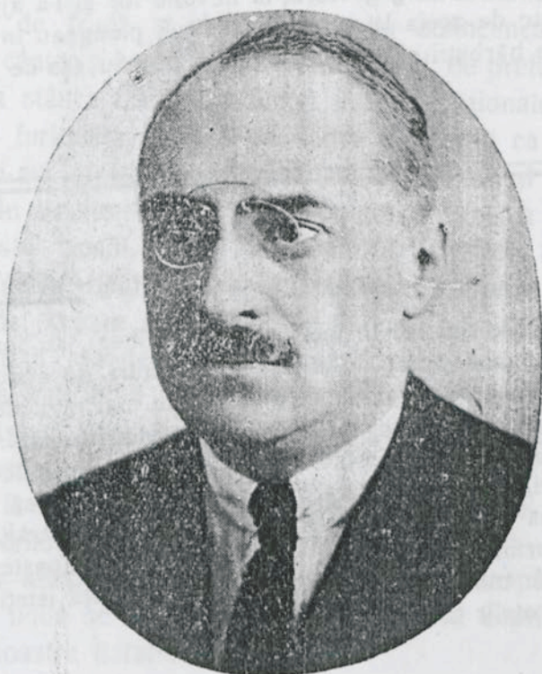
I. G. DUCA

Când pentru prima dată trecând în Ardeal I. G. Duca a fost inspirat să viziteze un sat de munte din marginine jud. Sibiu, am avut cel dintâi prilej să constatăm dragostea nedes-