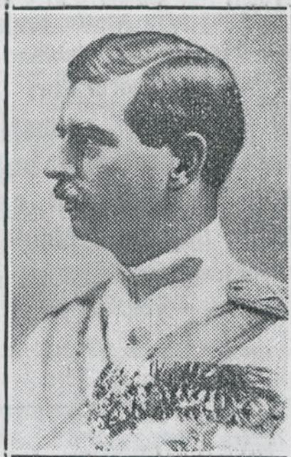
M. S. REGELE CAROL al II-lea

Sunt zile cari prin însemnătatea lor se tipăresc adânc în mintea popoarelor. Zile pline de nădejde și avânt pentru țară, zile ce risipesc desnădejdi și nu-