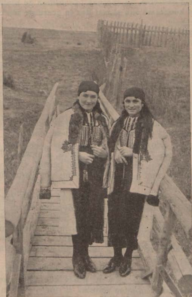
Poiana-Sibiului