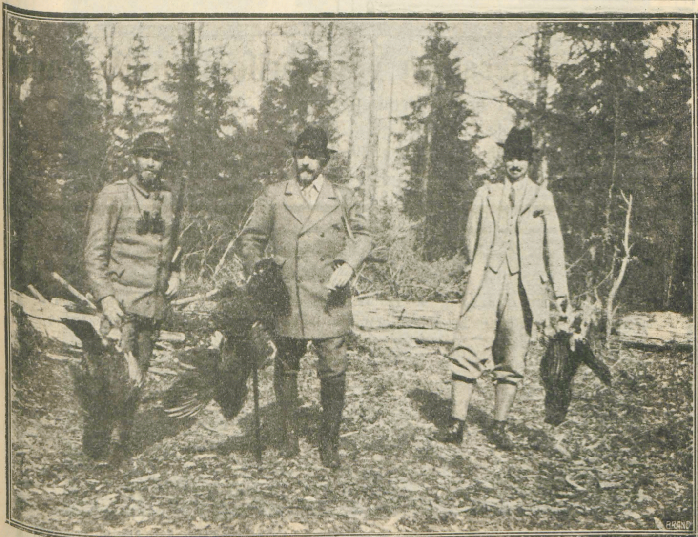
M. S. REGELE LA VÂNATOARE DE COCOȘI DE MUNTE