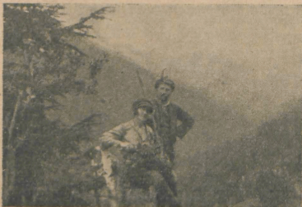
Doi „Șoimii” spre vârful Negoiu