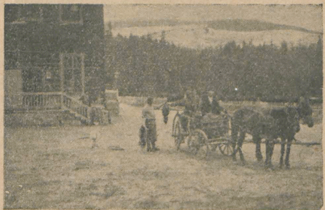
Rezultatul unei vânători în munții Ghiur ghiului: un urs, trei cerbi.