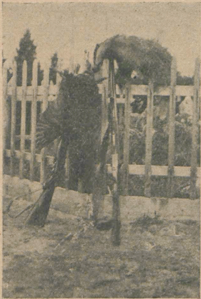
Un viezure și un cocoș de munte vânași la Păltiniș, lângă Sibiu